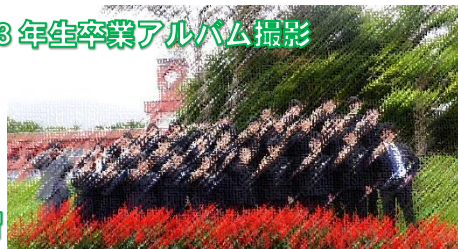
3年生卒業アルバム撮影